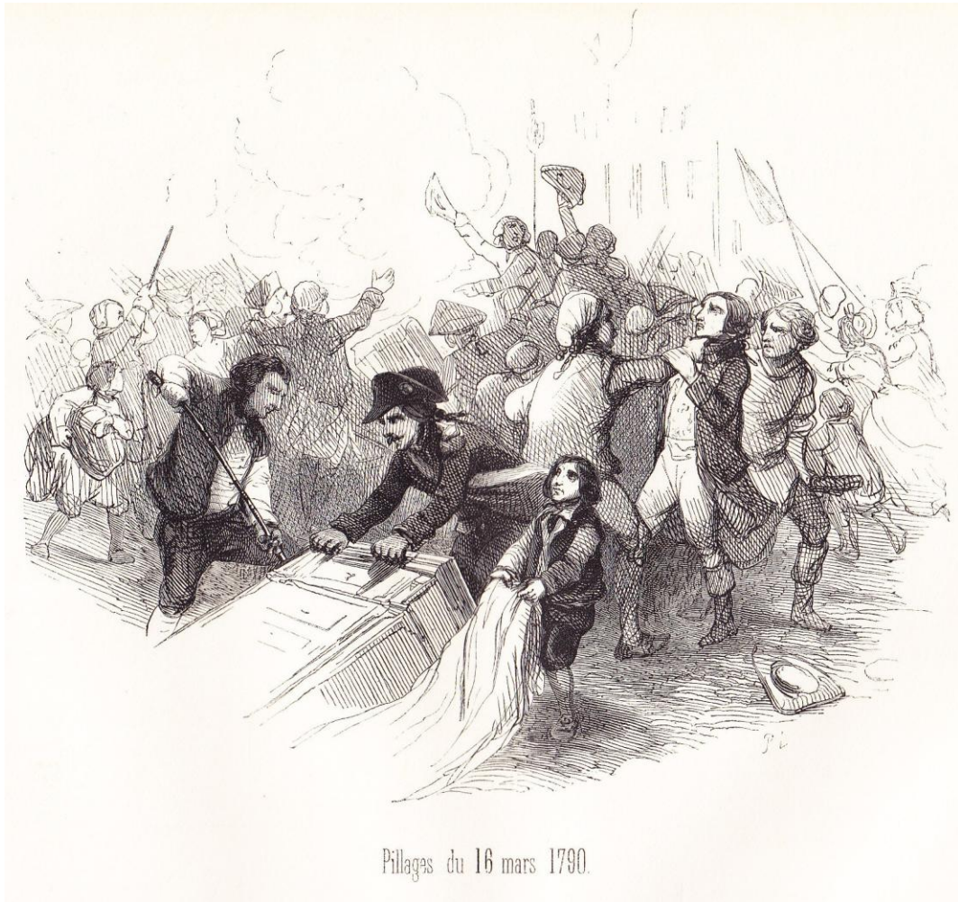
Pillages du 16 mars 1790 entre les pages 238 et 239 de Belges illustres 1 (1844)